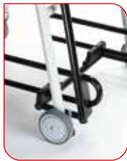
Los apoyapiés y apoyabrazos rebatibles facilitan la tarea de sentarse en la silla y bajarse de ella.