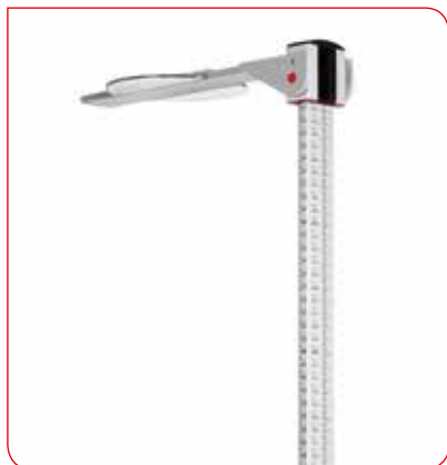
Les chiffres s'affichant sur le côté sont faciles à lire.

La technologie sans fil seca 360° wireless permet au seca 704s de transmettre toutes les valeurs mesurées à l'imprimante 360° wireless disponible en option. Grâce au logiciel seca analytics 115 connectable en réseau et à l'adaptateur sans fil 360° wireless USB seca 456, vous pourrez recevoir et exploiter les données sur votre ordinateur. Vous pourrez aussi les intégrer aux dossiers médicaux électroniques (DME) existants. Le seca 704s avec fonction DME intégrée est de ce fait prêt à affronter les dossiers médicaux numériques ainsi que toutes les exigences qui se poseront dans le futur. Pour plus d'informations sur la fonction DME, cliquez sur www.seca.com .