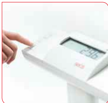
Doté de la technologie seca 360° wireless, le modèle seca 704s est en mesure de transmettre toute valeur vers une imprimante sans fil seca ou vers le logiciel seca installé sur votre ordinateur.