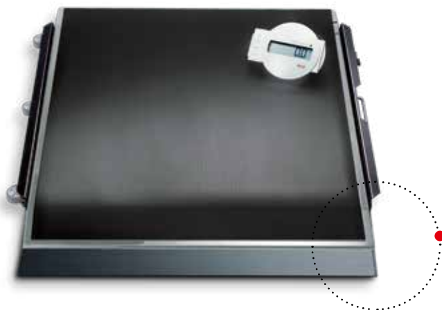
Uma rampa para fácil acesso de cadeiras de rodas é incluída na entrega.