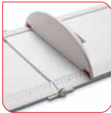
La escala, bien dimensionada, permite una lectura rápida del resultado.

La tabla de medición seca 417 se abre mediante una bisagra. Dispone de un tope integrado para la cabeza y de un tope separado para los pies, que se desliza con suavidad y precisión en un sistema de rieles de guía ligeramente elevado. Para medir la talla, sólo se debe colocar la cabeza del pequeño debajo del tope hasta que haga contacto con él, estirar cuidadosamente las piernas y subir el tope para los pies, hasta que toque las plantas de los pies del bebé.