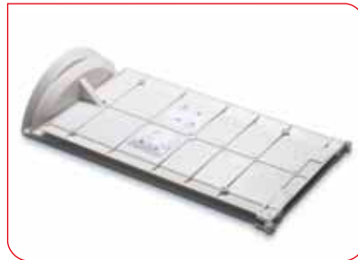
El mecanismo de plegado, de alta calidad, garantiza una larga vida útil.

El infantómetro seca 417 es ideal para el uso móvil; por ejemplo, para comprobar el estado nutricional y de desarrollo de lactantes y niños pequeños cuando se realizan exámenes en serie. Porque justamente en casos como éste, es importante que los resultados de medición se puedan leer fácil y rápidamente; lo aseguran las marcas de lectura rojas y una impresión de escalas de alta calidad, que sigue conservando su excelente legibilidad después de muchos años de uso intensivo.