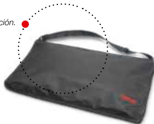
Bolsa seca 412 para una cómoda transportación.