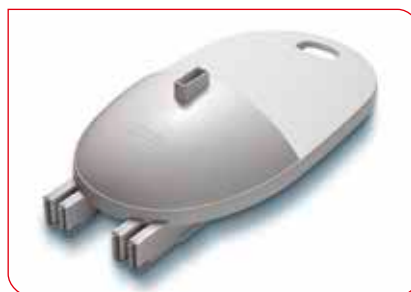
Manija integrada y bloqueos seguros en todas las piezas para una fácil transportación.