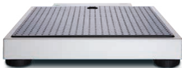
O desenho plano e a superfície antiderrapante garantem acesso fácil e apoio firme.