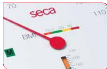
Le disque subdivisé en secteurs de différentes couleurs permet d'évaluer facilement le BMI.

Le design de cette balance allie élégance, fonctionnalité et ergonomie judicieuse. La lecture du poids sur le grand cadran rond incliné vers l'utilisateur est particulièrement commode. Grâce à son plateau très bas, la seca 756 est facilement accessible. Ses dimensions sont propres à permettre une pesée confortable des personnes de grande taille ou obèses. Par ailleurs, le plateau est revêtu d'un tapis de caoutchouc antidérapant pour leur sécurité.