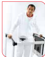
Pacjent w trakcie ważenia może stać lub siedzieć.

Dzięki bezprzewodowej transmisji danych seca 360° wireless, waga seca 685 może przesyłać każde wartości pomiaru do opcjonalnej drukarki 360° wireless. Dzięki rozwiązaniu jakie oferuje bezprzewodowe oprogramowanie seca emr flash 101 i