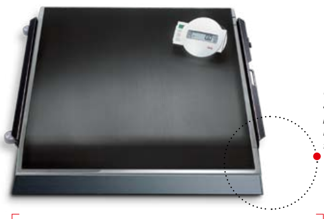
Une rampe est fournie avec la balance pour permettre aux fauteuils roulants d'y accéder facilement.