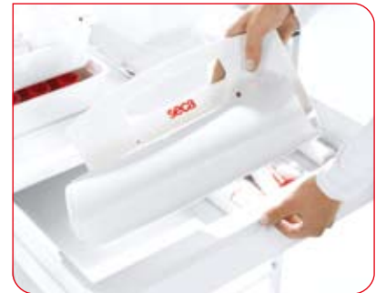
Peu encombrante, la toise-matelas peut être enroulée pour la ranger.

La surface est très facile à entretenir mais néanmoins robuste et peut être nettoyée avec tous les désinfectants courants.